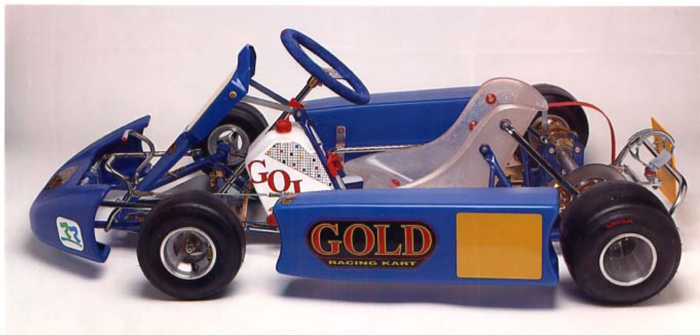
Photo du Kart avec carrosserie et pneumatiques