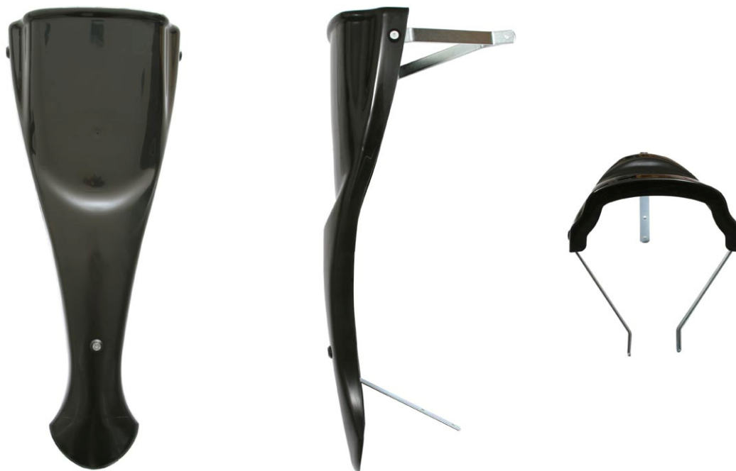
PHOTOS VUE DE DEVANT, DE DESSUS ET DE COTÉ, DU PANNEAU FRONTAL ET SUPPORTS PHOTO FROM FRONT, ABOVE AND SIDE OF FRONT PANEL WITH SUPPORTS

This Homologation Form reproduces descriptions, illustrations and dimensions at the moment of the CIK-FIA homologation.