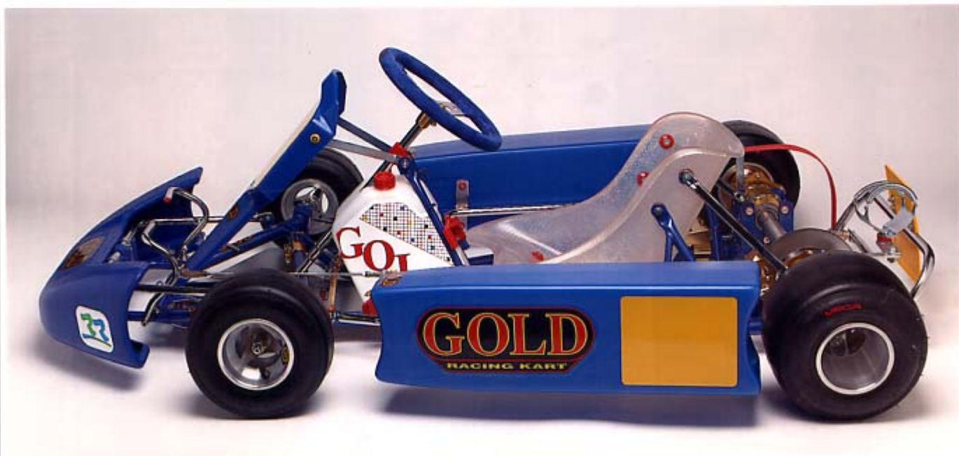
Photo du Kart avec carrosserie et pneumatiques

This homologation sheet reproduces descriptions, technical drawings and dimensions at the moment of the FMK-FIA homologation. With its homologation application, the applicant confirms, that all the requirements of the regulations are respected in full.