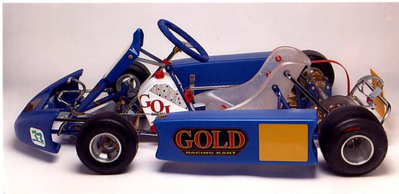
Photo du Kart avec carrosserie et pneumatiques

This homologation sheet reproduces descriptions, technical drawings and dimensions at the moment of the FMK-FIA homologation. With its homologation application, the applicant confirms, that all the requirements of the regulations are respected in full.