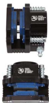
Etriers / Calipers