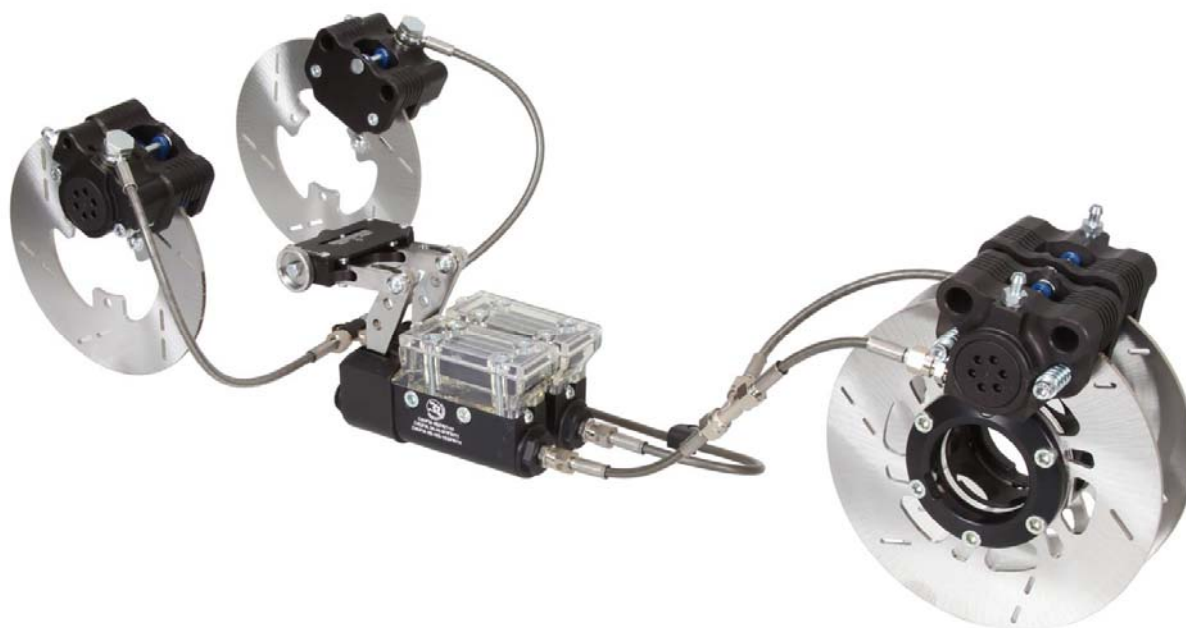
PHOTO VUE DE DESSUS DU SYSTÈME COMPLET ASSEMBLÉ

This Homologation Form reproduces descriptions, illustrations and dimensions of the brake system at the moment of the CIK-FIA homologation. The Manufacturer may modify them, but only within the limits set by the CIK-FIA Regulations in force.