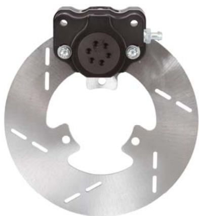
Photo du frein avant : étriers et disques seulement Photo of front brake: calipers and discs only