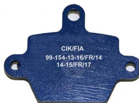
Plaquettes / Pads