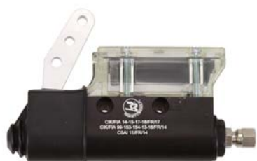
Maître-cylindre / Master-cylinder