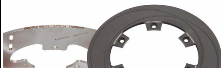
Disques / Discs