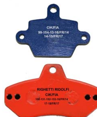
Plaquettes / Pads