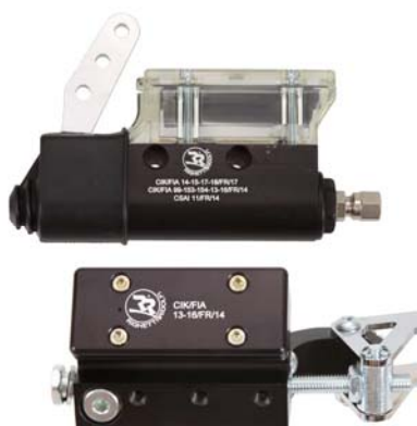
Maître-cylindre / Master-cylinder