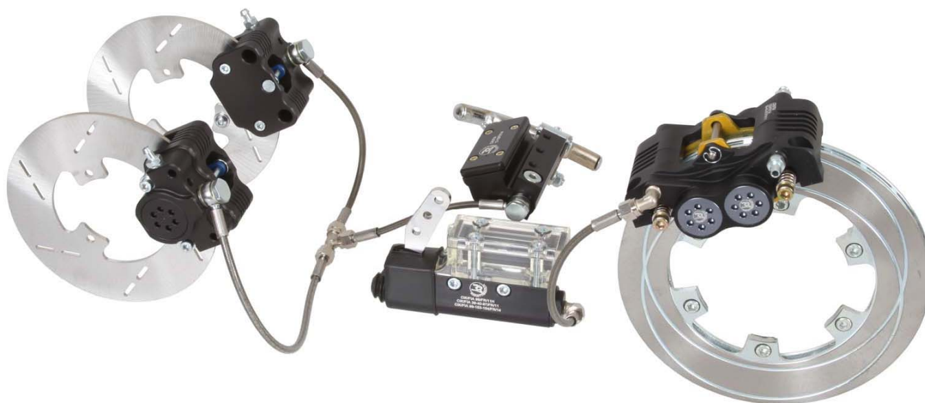
PHOTO VUE DE DESSUS DU SYSTÈME COMPLET ASSEMBLÉ

This Homologation Form reproduces descriptions, illustrations and dimensions of the brake system at the moment of the CIK-FIA homologation. The Manufacturer may modify them, but only within the limits set by the CIK-FIA Regulations in force.